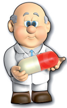
A votre pharmacien