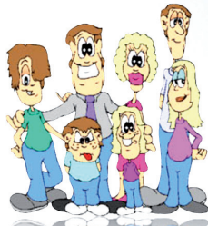
A votre entourage

Parce qu'il est très important de signaler à votre médecin et à votre pharmacien: