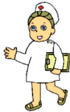
A votre infirmière